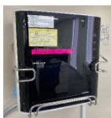
電解水素水生成器導入(ペット購入抑制)