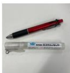
長期利用、再利用できるノベルティ