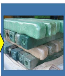
当社にてインゴット化して再生プラ原料になります