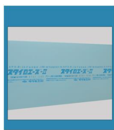
スタイロフォーム

当社にて再資源化のお手便いをさせていただきますので、是非お問い合わせください。(042-597-1115)