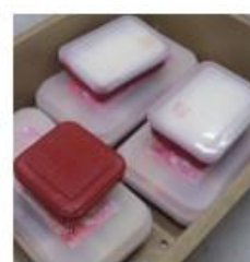
社内仕出し弁当はリターナブル容器業者