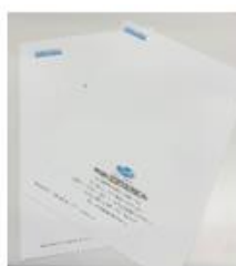
クリアファイルを紙製へ変更