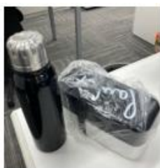
マイボトル・マイ弁当持参推奨

当社事業活動により発生するプラスチック廃棄物を削減、再資源化する取り組みとして、下記の様な取り組みを実施しています。(再資源化 0%、再資源化等率 100%)